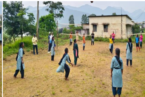
Games conducted to students on the eve of independenc day.